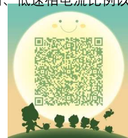
南京远驱控制软件交流 扫一扫二维码，加入群聊。