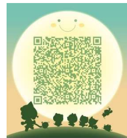
南京远驱控制软件交流 扫一扫二维码，加入群聊。