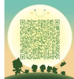
南京远驱控制软件交流 扫一扫二维码，加入群聊。

242: 30 号一线通, P 档在 DATA4 243: 一线通: 0x52,0x51 244: F2 一线通 245: 告警灯同步输出, 246: 在使用 485 接口时必须特殊帧=246 方便电脑 485 连接 247: 15 字节一线通 248: 13 字节一线通 249-NOSQH, 250-YJ 一线通,SEC0=255 允许 24 脚选择脉冲/一线通 251-PD0 检测一线通, 252-PA15 检测一线通 253: DY 一线通, 254:不带蓝牙的 485