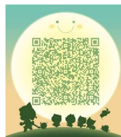
南京远驱控制软件交流 扫一扫二维码, 加入群聊。