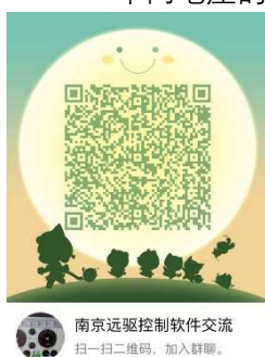
南京远驱控制软件交流 扫一扫二维码，加入群聊。